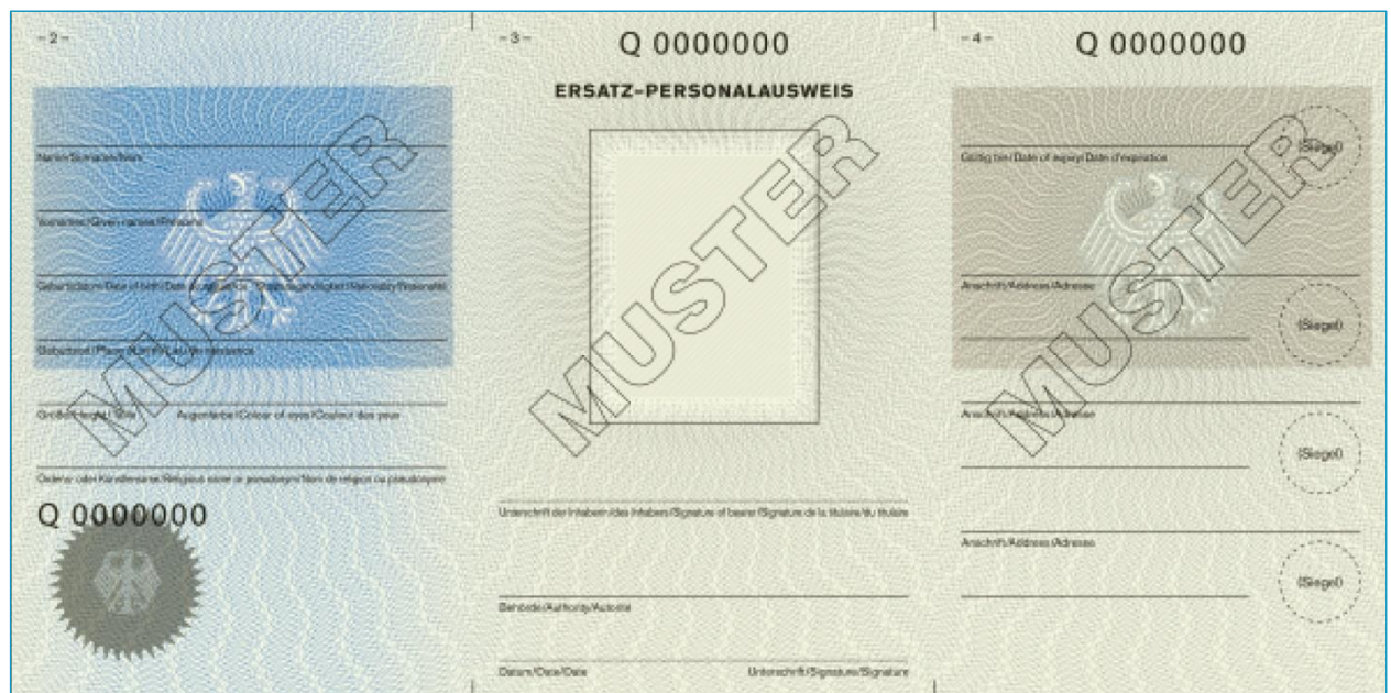
Abbildung 2: Muster des Ersatz-Personalausweises (Seiten 2/3/4)

Der Versand der Muster ist ab dem 12. Juni 2015 vorgesehen. Als Anlage zu diesem Infoschreiben erhalten Sie vorab zwei PDF-Dateien mit den Abbildungen der Vorder- und der Rückseite des Ersatz-Personalausweises im Originalformat und der Bemaßung der zu personalisierenden Felder.